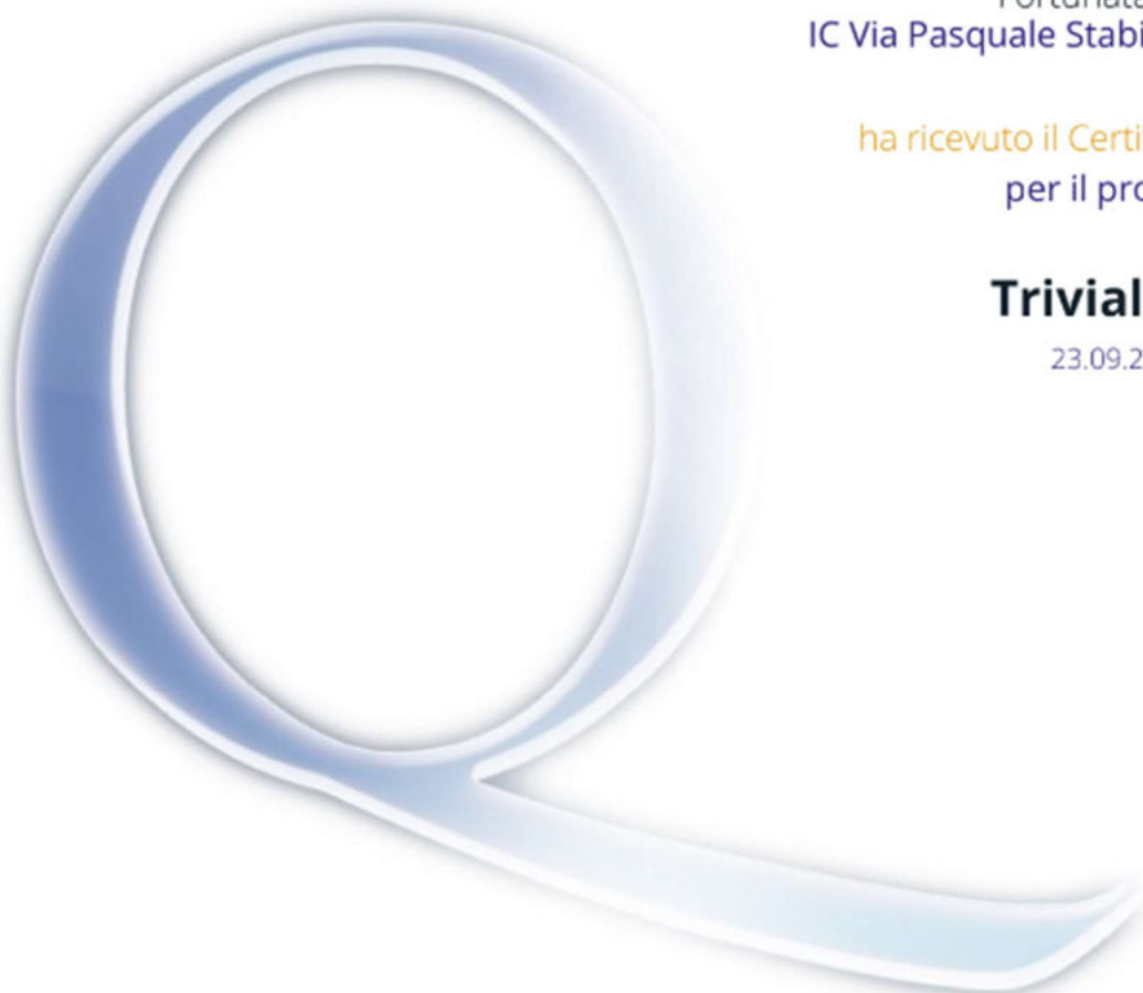
Donatella Nucci Unità Nazionale eTwinning Italia